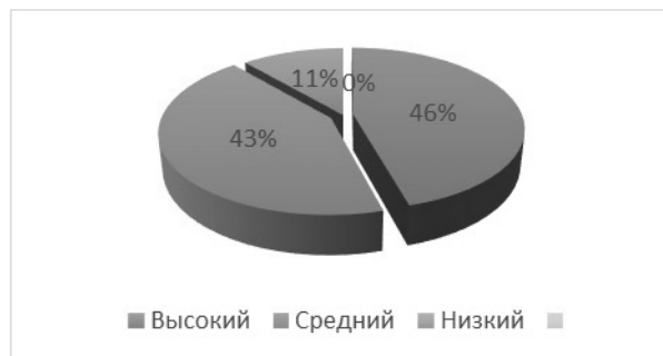
Рисунок 2. Распределение старшеклассников по уровням застенчивости (в %)

Анализируя полученные данные можно отметить, что наибольшее количество испытуемых обладают высоким уровнем застенчивости, их количество составляет 45,7% (16 чел.). Это свидетельствует о том, что данные старшеклассники склонны часто отмалчиваться в компаниях, они с трудом заводят новые знакомства, считают себя недостаточно хорошими и сомневаются в своих возможностях. Особо подчеркнем, что результаты указывают на негативную тенденцию, которая в будущем может привести к серьезным последствиям в процессе взросления, когда застенчивость «сковывает» индивида и не позволяет ему полноценно реализовываться и проявлять себя в социуме. Вместе с тем, 4 школьника, (11,4%) обладают низкими показателем по данному параметру, что характеризует их как открытых, быстро идущих на контакт, заинтересованных в новых знакомствах и общении. Такие личности с лёгкостью адаптируются к смене обстановки, их не смущает появление чего-то или кого-то нового. 15 старшеклассников (42,9%) обладают средним уровнем выраженности застенчивости, что является оптимальным уровнем данного показателя. Представленные данные изображены графически на рисунке 2.